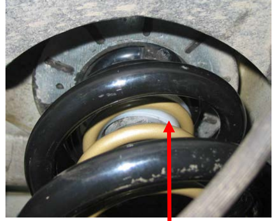
Position de la bague Nylon (2) sur le haut du ressort auxiliaire.